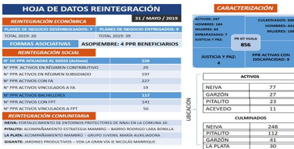
Figura No. 1 Hoja de datos reintegración- datos de la ARN.

El siguiente trabajo de investigación tendrá como referencia empresarios de diferentes sectores económicos que conforman las 19 agremiaciones ubicados en el municipio de Neiva Huila y la percepción que estos tienen de las personas desmovilizadas residentes en el municipio de Neiva, departamento del Huila.