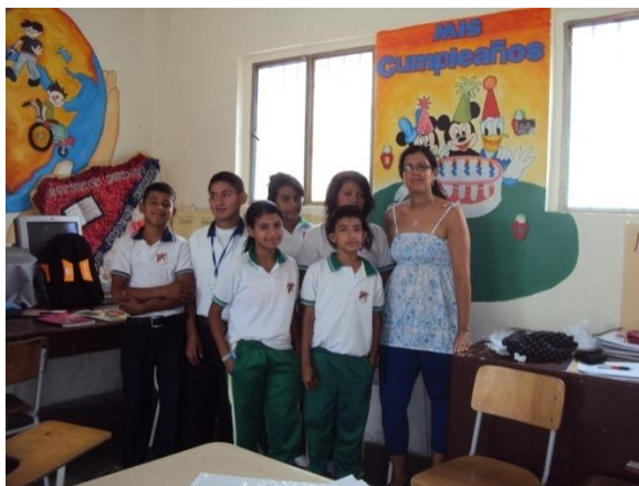
Foto 2. Aula Multigradual. I.E. Misael Pastrana Borrero

En cuanto a los estudiantes con discapacidad, se advierte que para ellos falta señalización. El asunto del timbre de colores es una herramienta clave para que los sordos sepan el momento en el que hay cambio de clases, o cuando llega el momento de salida y descanso. En este sentido se advierte que la falla no solo está en la existencia o no de tales herramientas, sino también en la falta de apropiación que hay para con ellas. No sería suficiente la incorporación de señales en toda la planta física si no hay un acompañamiento adecuado por parte de los maestros. De tal forma que la experiencia en el colegio sea un análogo de lo que tendrán que enfrentar en la vida diaria. Claro, en la vida diaria es evidente que tendrán que vérselas con un mundo mayoritariamente oyente, pero tener consciencia de los compromisos y necesidades que la sociedad tiene que asumir respecto a ellos, les permitirá exigir con mayor propiedad sus derechos.