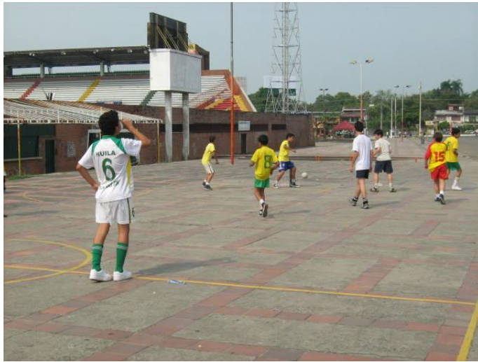
FOTO 13, 14,15 DESARROLLO DEL TALLER CON USUARIOS DE LA CICLOVIA