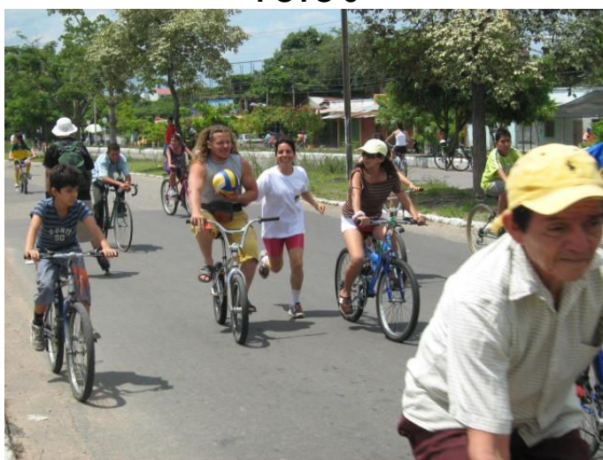
FOTO 6, 7, 8,9, 10, 11,12. USUARIOS REALIZANDO OTRAS ACTIVIDADES EN EL ESPACIO PROGRAMADO PARA EL DESARROLLO DE LA CICLOVIA.