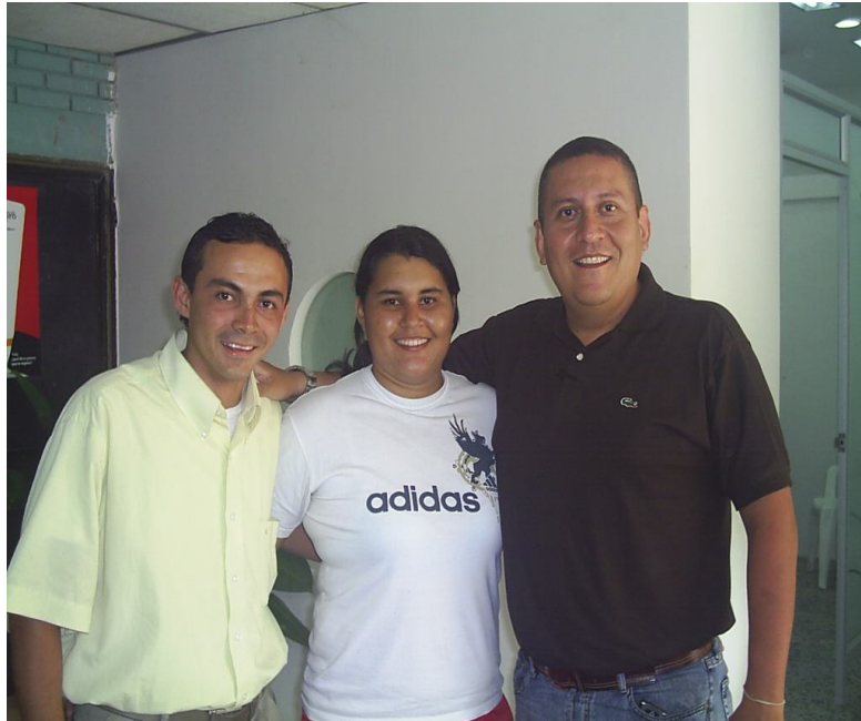
FOTO 2. UNA DE LAS VISITAS REALIZADAS A LA CICLOVIA