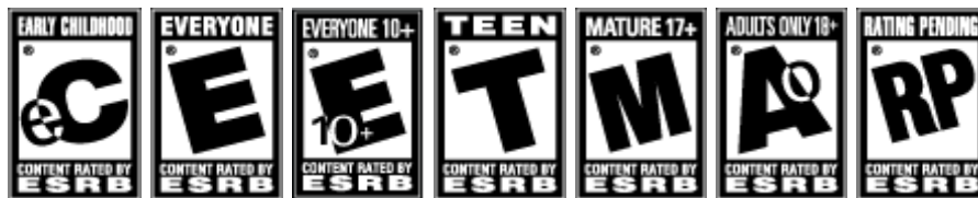
Figura 2. Símbolos de Clasificación por Edades, sistema ESRB