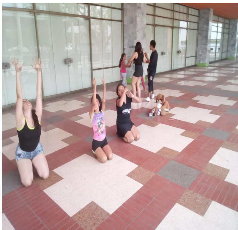
Taller No. 4