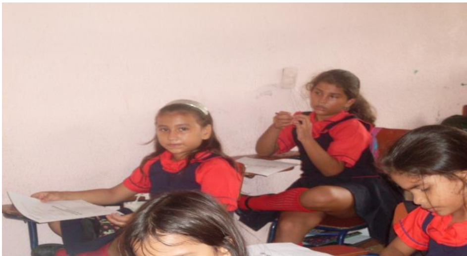
ESTUDIANTES DEL GRADO TERCERO