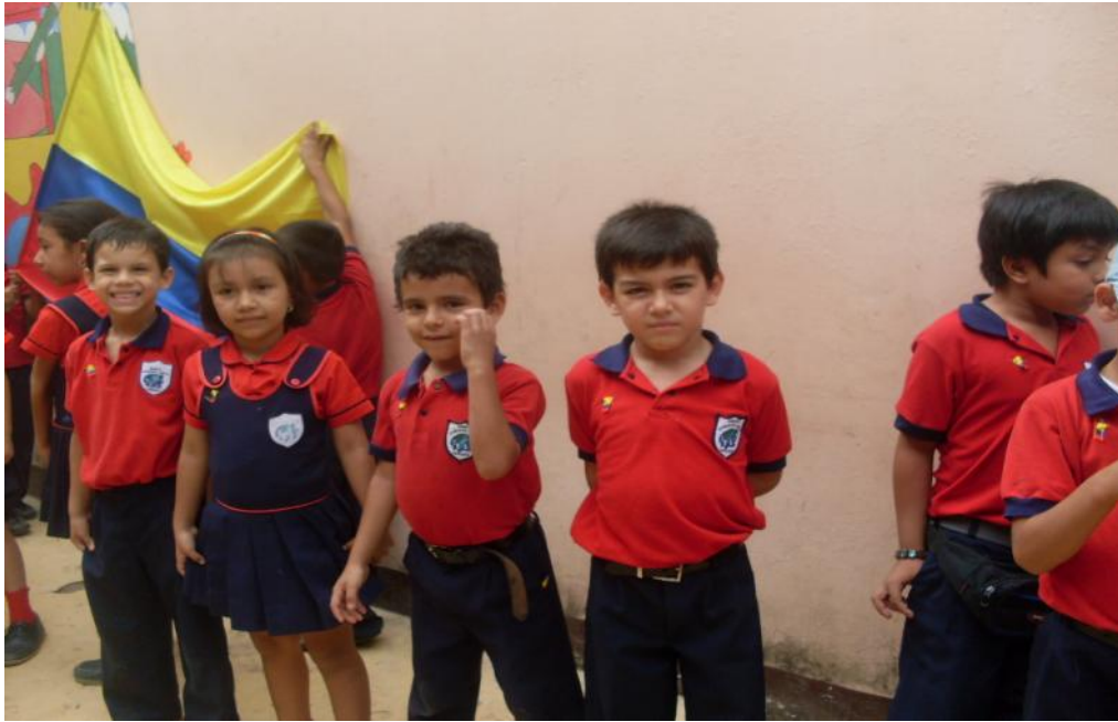
ESTUDIANTES DEL GRADO SEGUNDO