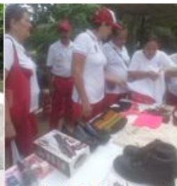
Actividad trueque 2 de octubre 2018