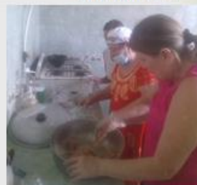
Taller de hamburguesas 26 octubre 2018

Archivo álbum, Proyecto caminemos por la vida