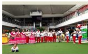
Presentación en San Pedro Plaza, 19 agosto 2018