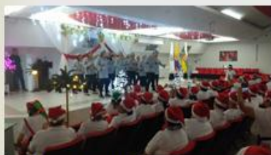
Navidad fantástica 2018