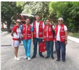
Participación de los estudiantes de enfermería USCO