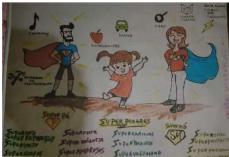
Figura 4. Elaboración de historieta por parte de padre de familia 5. Fuente: instrumento de recolección 3.

En el sexto dibujo, realizado por el padre de familia 6, se apreció el núcleo familiar (padre, madre, hijos) cogidos de la mano, en un espacio abierto, acompañados por el sol, nubes y una cometa que sostiene uno de los hijos. Esta imagen permitió interpretar que a partir de los talleres de Súper Pá y Nuevas Masculinidades se cohesiona el tejido familiar, permitiendo el afianzamiento de la vinculación afectiva entre padres e hijos, como también el compartir el tiempo en las actividades que requiera la unidad familiar, en este caso, la elevada de las cometas. Se apreciaron las interpretaciones vividas por el padre de familia, que fueron los cambios de actitud hacia sí mismo y hacia los demás, colaborar en las labores del hogar, mejorar la comunicación asertiva, transmitir una energía diferente cuando se dispone a compartir en otros espacios de juego. Brindó la oportunidad de la esperanza, al depositar los sueños y las ilusiones de los niños mediante la cometa como elemento simbólico de cambio.