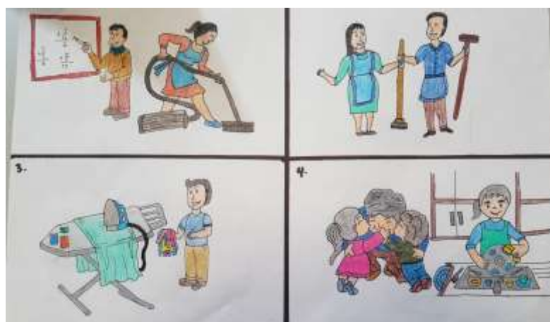
Figura 3. Imagen del grupo cuatro. Tomado de instrumento de recolección 2.

En esta interpretación se afirmó nuevamente la transformación del hogar. El cambio de roles en lo laboral. Los cambios paulatinos vividos día a día por parte de los padres de familia. Hogares comprensivos y amorosos.