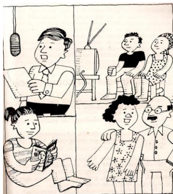
Gráfica 2. ¿Cuál es el verdadero proceso de comunicación?

Las cuatro imágenes de la ilustración muestran procesos de comunicación, es necesario tener en cuenta que las tres primeras son procesos de comunicación que se refieren a la transmisión de información y la cuarta es la comunicación de interacción personal que logra establecer diálogo entre los interlocutores.